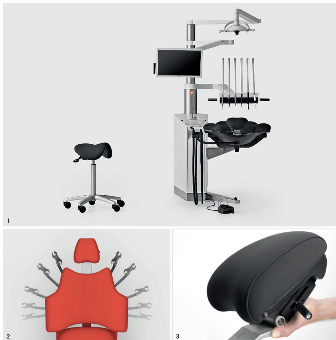
Abb. 1: Die neue XO FLEX 2020. Abb. 2: Mit dem XO Ambidex Saugschlauchsystem kann der Schlauch ohne Umbau von links nach rechts bewegt werden. Abb. 3: Die Neigung der Nackenstütze lässt sich leicht einstellen.

Ein weiteres Plus der XO FLEX 2020 ist die serienmäßige Ausstattung der Einheit mit einem Wasserdesinfektionssystem inklusive Rückflussverhinderung, die damit den