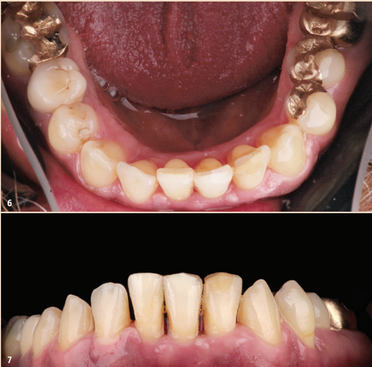
Abb. 6 und 7: Die Zähne 32 und 41 sind in den Zahnbogen integriert, der wie geplant sehr gut ausgeformt wurde.

liegenden Fall für die Behandlung mit den nahezu unsichtbaren Alignern.