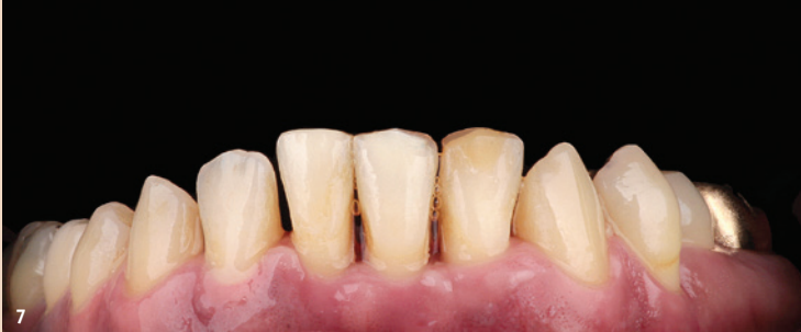
Abb. 6 und 7: Die Zähne 32 und 41 sind in den Zahnbogen integriert, der wie geplant sehr gut ausgeformt wurde.

liegenden Fall für die Behandlung mit den nahezu unsichtbaren Alignern.