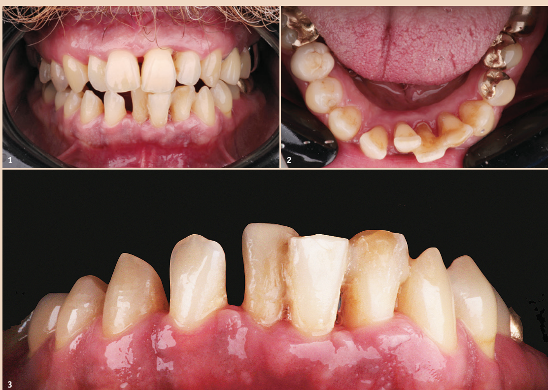
Abb. 1: Patient mit einer generalisierten schweren chronischen Parodontitis. Im Unterkiefer ist eine Zahnfehlstellung erkennbar, die ihn ästhetisch, phonetisch und funktionell beeinträchtigt. – Abb. 2 und 3: Fehlstellung 41 und 42 mit unschöner Lücke im Frontzahnbereich.

Im Vergleich zu festsitzenden KFO-Apparaturen, zum Beispiel Brackets, ist die Zahnpflege aufgrund der herausnehmbaren in-line®-Schienen deutlich einfacher. Auch dieser Aspekt sprach im vor-