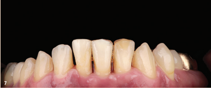
Abb. 6 und 7: Die Zähne 32 und 41 sind in den Zahnbogen integriert, der wie geplant sehr gut ausgeformt wurde.

liegenden Fall für die Behandlung mit den nahezu unsichtbaren Alignern.