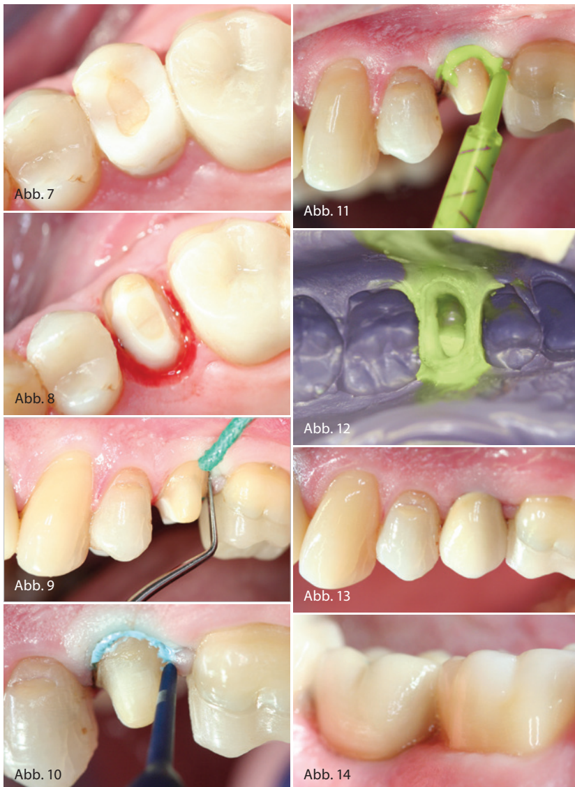
Abb. 7: Zahn 25 mit Aufbaufüllung. Abb. 8: Blutung aus dem Sulkus nach der Präparation. Abb. 9: Faden legen zur Sulkusöffnung an Zahn 25. Abb. 10: Applikation der Retraktionspaste (3M Adstringierende Retraktionspaste). Abb. 11: Handliche Applikation der Light Body Masse. Abb. 12: Präzisionsabformung mit Impregum Super Quick Polyether Abformmaterial. Abb. 13: Die definitive Restauration an Zahn 25. Abb. 14: Die definitive Restauration in Regio 37.

sprühen. Nach dieser sorgfältigen Vorbereitung ist die perfekte Abformung auch subgingivaler Präparationsränder zuverlässig möglich.