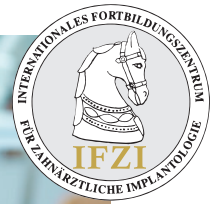
Chirurgie mit Workshop am Phantom

Es können 11 Fortbildungspunkte erworben werden. Das Anmeldeformular kann auf der Website des IFZI heruntergeladen werden.