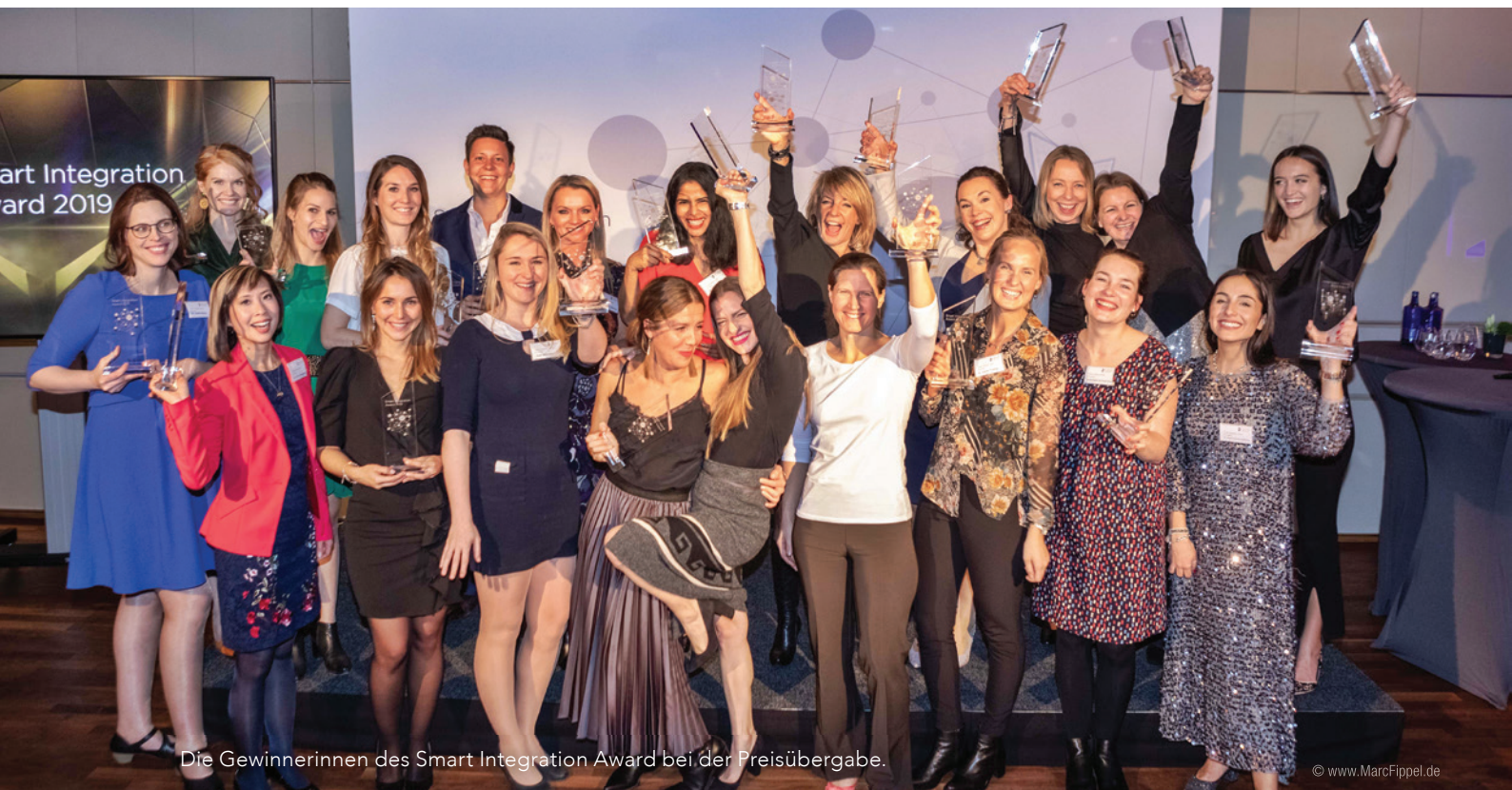
Die Gewinnerinnen des Smart Integration Award bei der Preisübergabe.