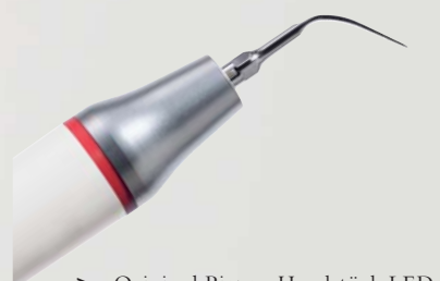
> Original Piezon Handstück LED mit EMS Swiss Instrument PS

Praktisch keine Schmerzen für den Patienten und maximale Schonung des oralen Epitheliums – grösster Patientenkomfort ist das überzeugende Plus der Original Methode Piezon, neuester Stand. Zudem punktet sie mit einzigartig glatten Zahnoberflächen. Alles zusammen ist das Ergebnis von linearen, parallel zum Zahn verlaufenden Schwingungen der Original EMS Swiss Instruments in harmonischer Abstimmung mit dem neuen Original Piezon Handstück LED.