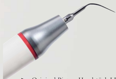
> Original Piezon Handstück LED mit EMS Swiss Instrument PS

Praktisch keine Schmerzen für den Patienten und maximale Schonung des oralen Epitheliums – grösster Patientenkomfort ist das überzeugende Plus der Original Methode Piezon, neuester Stand. Zudem punktet sie mit einzigartig glatten Zahnoberflächen. Alles zusammen ist das Ergebnis von linearen, parallel zum Zahn verlaufenden Schwingungen der Original EMS Swiss Instruments in harmonischer Abstimmung mit dem neuen Original Piezon Handstück LED.