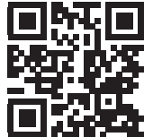
ISMI – Anmeldung/Programm