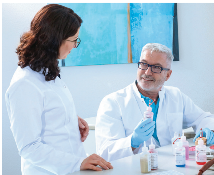
Die praktische Umsetzung steht bei allen Kursen an erster Stelle.