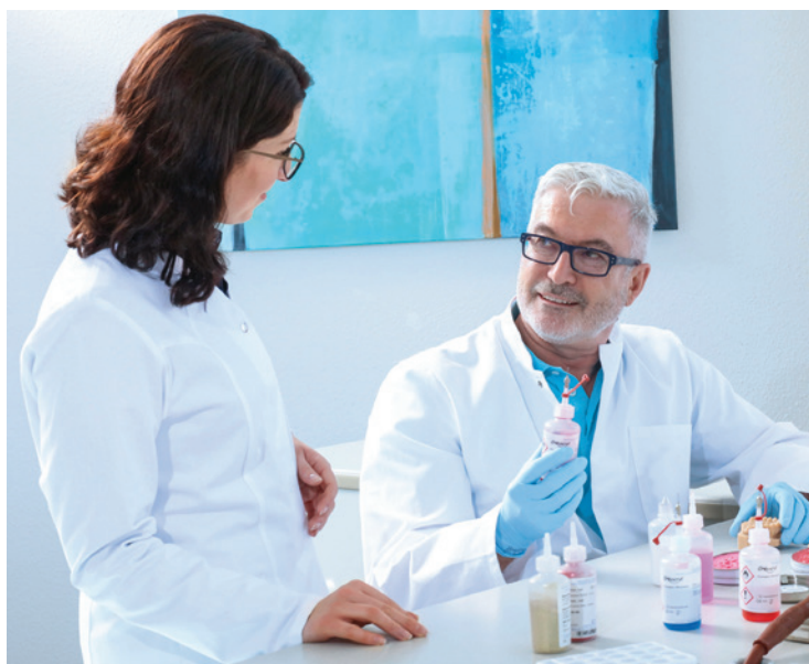
Die praktische Umsetzung steht bei allen Kursen an erster Stelle.