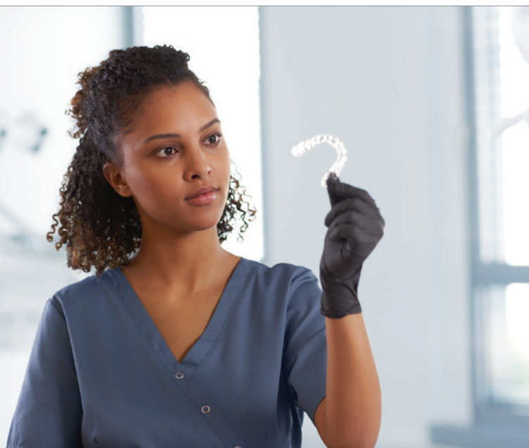
Teilnehmer haben die Gelegenheit, in praktischen Workshops und Hands-on-Sessions die neuesten Möglichkeiten des digitalen Behandlungskonzepts SureSmile zu entdecken.