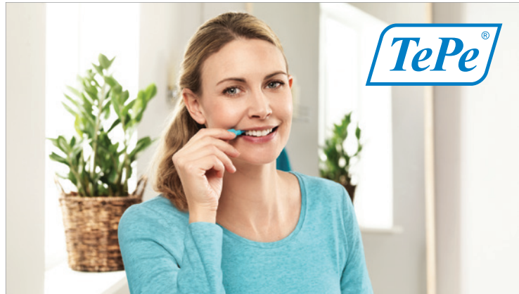
Im Vergleich zu Zahnhölzern, Zahnseide und Interdentalsticks gelten Interdentalbürsten als effektivstes Instrument zur gründlichen Zahnzwischenraumpflege.

Dass das beliebteste Hilfsmittel bei der täglichen Mund- und Zahnpflege – die Zahnbürste – nur etwa 60 Prozent aller Zahnoberflächen inklusive der Zahnzwischenräume erreicht, ist allerdings nur einem Viertel aller Befragten bekannt.