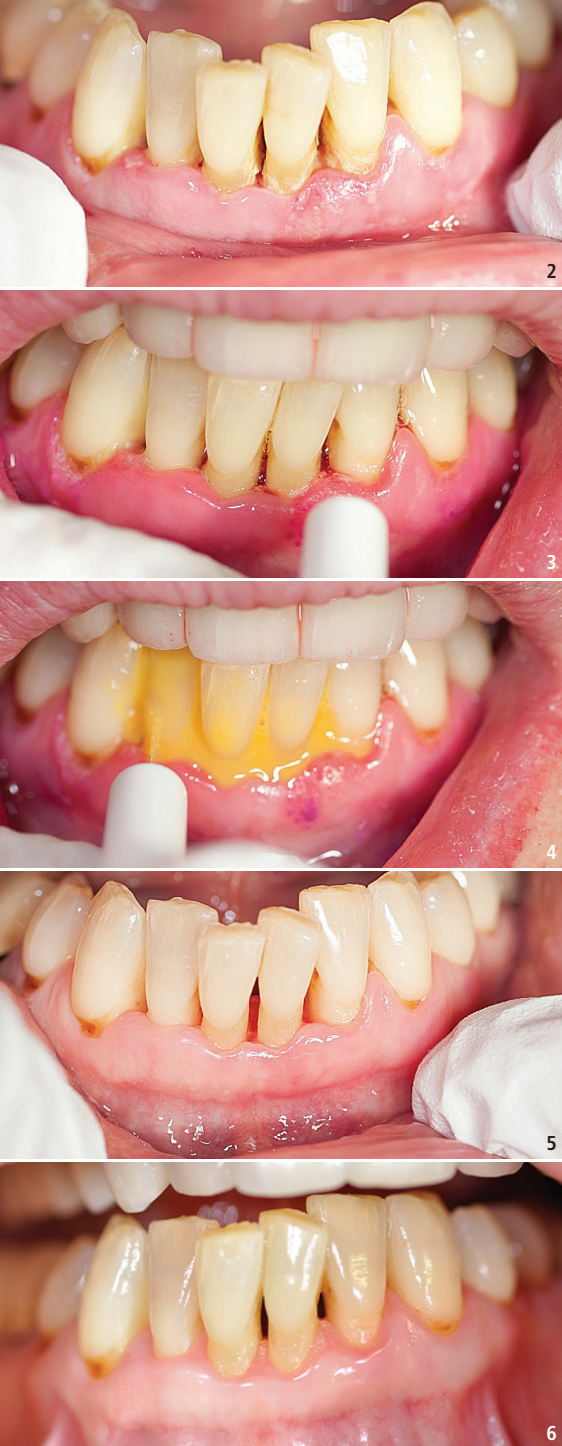
Abb. 2: Ausgangssituation: akute Schmerzen im Unterkiefer, Lockerungsgrad II bis III. – Abb. 3: Instrumentelle Erstreinigung unter Anästhesie. – Abb. 4: Besprühen der Wundfläche mit flüssigem Coenzym Q10. – Abb. 5: Recalltermin eine Woche später: Zähne 31 und 32 sind fester, keine Blutungen. ParoMit® Q10 wurde weiter unterstützend gesprüht. – Abb. 6: Halbjahreskontrolle: Die Gingiva ist rosa und straff, Taschentiefe bei allen Zähnen beträgt 2 mm, es gibt keine Lockerung mehr.

dramatischer) die Citratsynthese um 77 Prozent. Damit wurde erstmals der Beweis erbracht, dass das Abwehrsystem beim Vorhandensein einer Parodontitis massiv lahmt. Dies wirkt sich nicht nur lokal auf die zahnerhaltenden Strukturen – Rötung, Blutung, Pusaustritt, Knochenabbau etc. – aus, sondern hat auch systemische Auswirkungen, wie Studien zeigen. 4