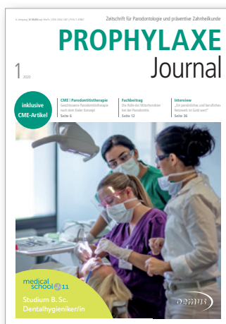
Titelbild: Medical School 11 i. Gr.*