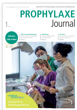
Titelbild: Medical School 11 i. Gr.*