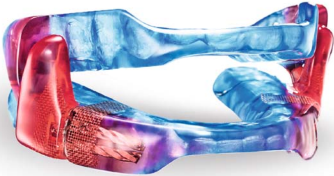
Respire Blue+ Whole You™