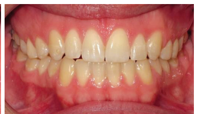
Wie mithilfe von Alignern selbst bei herausfordernder Indikation kontrollierte Zahnbewegungen realisiert werden können, wird u. a. Gegenstand dieser intensiven Fortbildung sein.