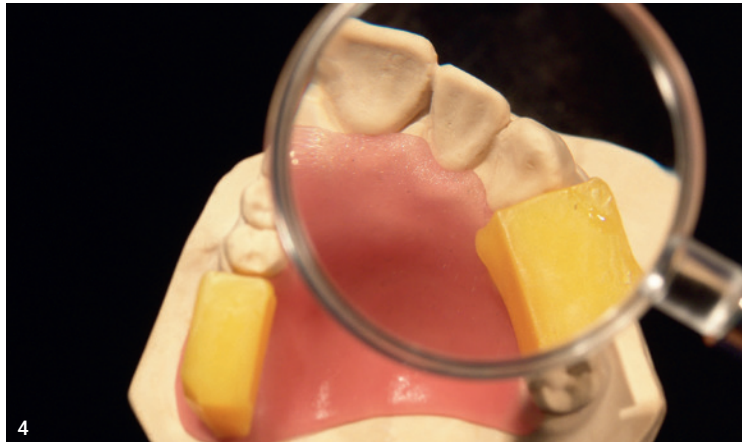
Abb. 1: primobase mit 1,2 mm-Plattenstärke extrem dünn und gleichzeitig hochstabil. Abb. 2: Durch die exakte und präzise Passung „saugt“ sich die Aufstellung bei der Einprobe gut im Mund des Patienten an. Abb. 3: Maximaler Anpressdruck und damit bestmögliche Passung, wenn die primobase Platte während der Lichthärtung in der Metavac-Einheit tiefgezogen wird. Abb. 4: Beste Lichthärteeigenschaften – kein zweiter Polymerisationsdurchgang ohne Modell erforderlich.

definiertem Druck an das Modell gepresst. Weitere Informationen zum Produkt sind auf der Homepage von primotec erhältlich.