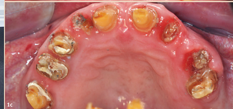
Abb. 1a-c: Kariöse Destruktionen unter den Kronen bei einer Patientin mit Morbus Alzheimer.

gesunden, funktionellen, ästhetisch akzeptablen und schmerzfreien Zustand bei diesen Patienten zwar erstrebenswert, aber nicht immer realisierbar ist, sollte auch bei ihnen im Rahmen regelmäßiger Kontrolltermine sichergestellt werden, dass sie keine Schmerzen haben und eine häusliche sowie professionelle Zahnpflege regelmäßig durchgeführt wird.