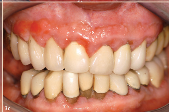
Abb. 2: Wurzelkaries bei einem Patienten mit medikamentös assoziierter Mundtrockenheit. – Abb. 3a-c: Schonende Therapie medikamentös assoziierter gingivaler Wucherungen.