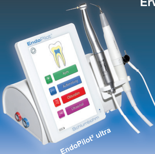
EndoPilot 2 ultra