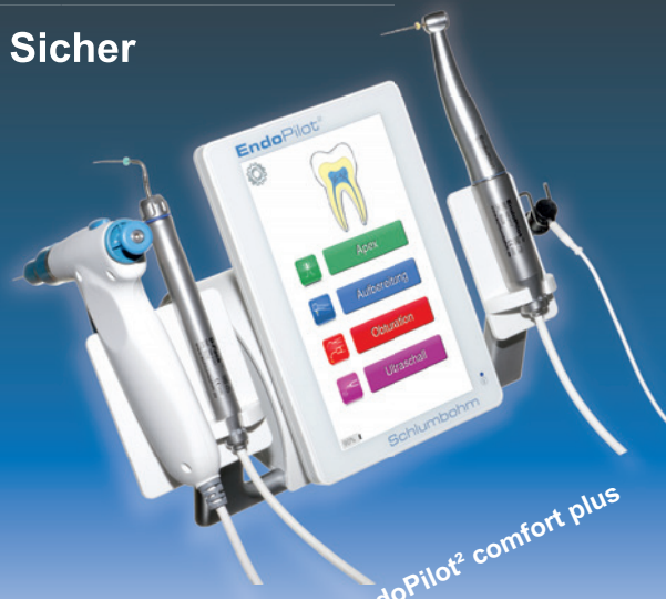
EndoPilot 2 comfort plus