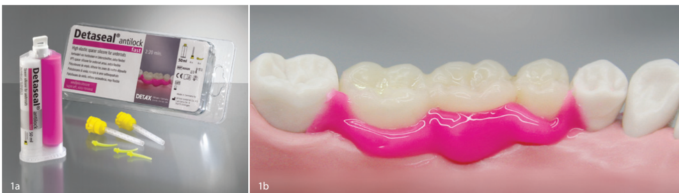
Abb. 1a und b: Detaseal® antilock.

Überzeugt sind die Zahnärztinnen und Zahnärzte von der guten Qualität der Abdrücke, weil das Material in den Interden-