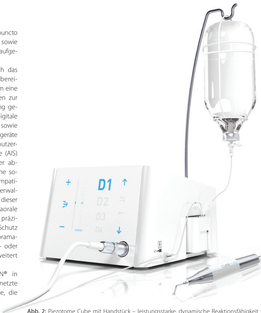
Abb. 2: Piezotome Cube mit Handstück – leistungsstarke, dynamische Reaktionsfähigkeit für eine überlegene Knochenchirurgie.

Die Sparte der Verbrauchsmaterialien führt ACTEON® unter dem Geschäftsbereich PHARMA: Hier sind unter anderem die bewährte Retraktionspaste Expsyl als auch die hygienischen Einwegansätze Riskontrol zu nennen. Für die Vielzahl an Praxen, die sich dafür entschieden haben, sind diese Produkte aus ihrem Alltag nicht mehr wegzudenken.