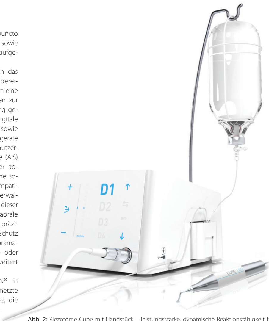
Abb. 2: Piezotome Cube mit Handstück – leistungsstarke, dynamische Reaktionsfähigkeit für eine überlegene Knochenchirurgie.

Die Sparte der Verbrauchsmaterialien führt ACTEON® unter dem Geschäftsbereich PHARMA: Hier sind unter anderem die bewährte Retraktionspaste Expsyl als auch die hygienischen Einwegansätze Riskontrol zu nennen. Für die Vielzahl an Praxen, die sich dafür entschieden haben, sind diese Produkte aus ihrem Alltag nicht mehr wegzudenken.