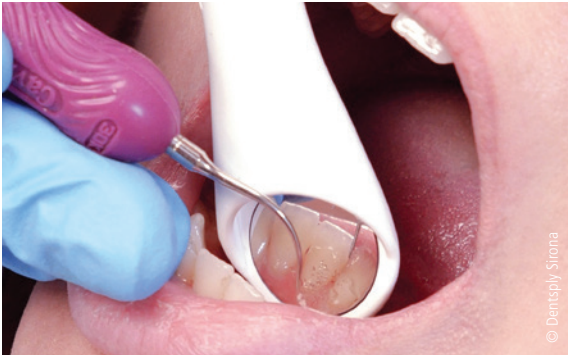
Abb. 2: Durch die Kombination von Spiegel und Absaugung lässt sich „eine zusätzliche Hand“ gewinnen – ein spürbarer Vorteil gerade für das autonome Arbeiten am Patienten.

Praxisteams profitieren vom Spiegelsauger – insbesondere dann, wenn effizientes und zügiges Arbeiten gefragt sind. Gerade bei einer selbstständigen Tätigkeit auf Umsatzbeteiligung kann sich der Zeitgewinn deutlich bemerkbar machen. In Zeiten des Fachkräftemangels kommen Zahnärzten die besseren Möglichkeiten zum autonomen Arbeiten entgegen. So kann die Behandlung dank des Purevac® HVE leichter alleine durchgeführt oder fortgesetzt werden, während die Assistenz schon andere Aufgaben übernimmt.