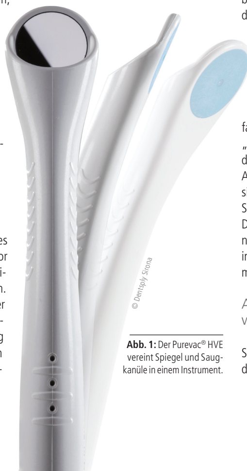
Abb. 1: Der Purevac® HVE vereint Spiegel und Saugkanüle in einem Instrument.

Sowohl der Zahnarzt als auch die in der Prophylaxe tätigen Mitglieder des