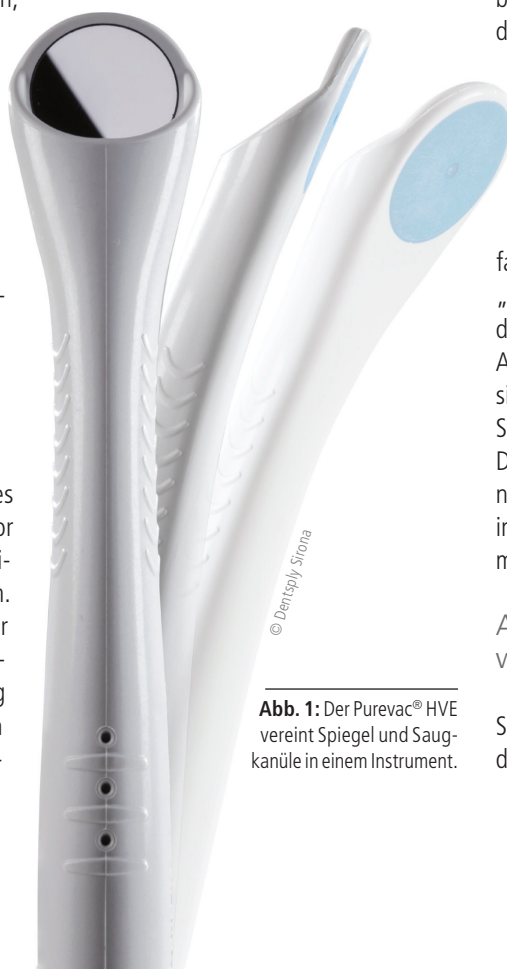
Abb. 1: Der Purevac® HVE vereint Spiegel und Saugkanüle in einem Instrument.

Sowohl der Zahnarzt als auch die in der Prophylaxe tätigen Mitglieder des