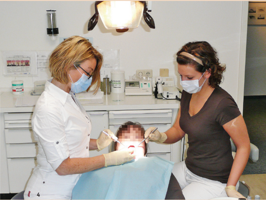
Abb. 4: Professionelle Zahnreinigung bei einer Patientin mit mentalen Funktionseinschränkungen.

Zahnklinik der Universität Witten/Herdecke Fakultät für Gesundheit Alfred-Herrhausen-Straße 50 58448 Witten, Deutschland Tel.: +49 2861 5151 pcichon@t-online.de