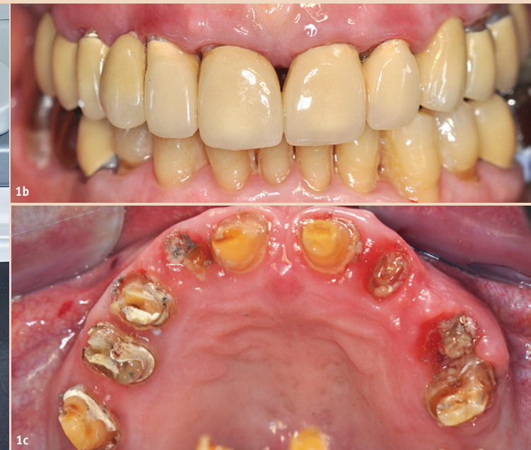
Abb. 1a–c: Kariöse Destruktionen unter den Kronen bei einer Patientin mit Morbus Alzheimer.

gesunden, funktionellen, ästhetisch akzeptablen und schmerzfreien Zustand bei diesen Patienten zwar erstrebenswert, aber nicht immer realisierbar ist, sollte auch bei ihnen im Rahmen regelmäßiger Kontrolltermine sichergestellt werden, dass sie keine Schmerzen haben und eine häusliche sowie professionelle Zahnpflege regelmäßig durchgeführt wird.