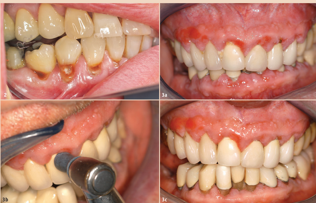
Abb. 2: Wurzelkaries bei einem Patienten mit medikamentös assoziierter Mundtrockenheit. – Abb. 3a–c: Schonende Therapie medikamentös assoziierter gingivaler Wucherungen.

Die Durchführung modifizierter Behandlungsabläufe bei Menschen mit schweren Allgemeinerkrankungen ist immer sehr (zeit-