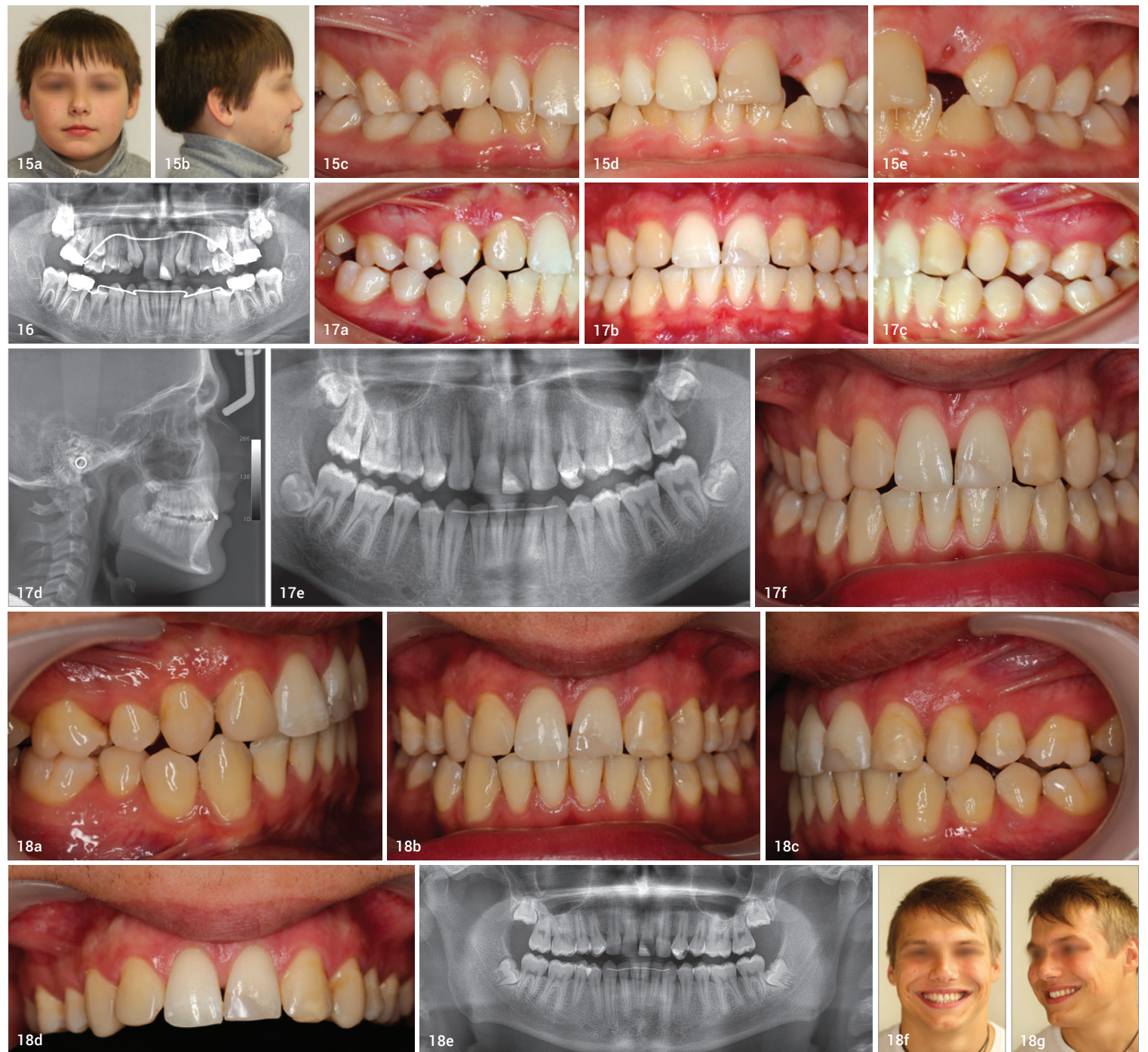
Abb. 15a–e: Patientenbeispiel 3. Klinische Ausgangssituation: extraorale (a und b) und intraorale Aufnahmen (c–e). Abb. 16: Das OPG zeigt den kieferorthopädischen Lückenschluss in der Front. Abb. 17a–f: Klinische Situation sowie OPG und FRS nach Behandlungsabschluss. Abb. 18a–g: Intraorale Situation (a–d), OPG (e) sowie extraorale Aufnahmen (f und g) zehn Jahre nach Behandlungsabschluss. Abb. 19a–c: Retention der Lücke mithilfe von Glasfaserfäden. Abb. 20a–d: Retention der Lücke mithilfe eines kieferorthopädischen Miniimplantats mit provisorischer Zahnkrone.