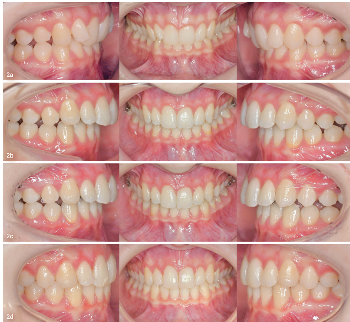
Abb. 2a: Klinische Ausgangssituation mit Klasse II/2-Malokklusion und fragiler Gingiva im Bereich der Unterkieferfront. Abb. 2b: Nivellierung und Ausformung mit vollständig individueller linguale Apparatur. Abb. 2c: Beginn der En-masse-Distalisation im Oberkiefer. Die Apparatur bleibt weiterhin unsichtbar. Abb. 2d: Behandlungsergebnis nach En-masse-Distalisation im Oberkiefer.

Auch die bukkale Minischraube wird im Regelfall mesial des ersten Molaren inseriert. Aufgrund des reduzierten interradikulären Platzangebotes sollte sie bei einer Länge von 10 mm mit 1,3 mm etwas dünner sein (z. B. Abso Anchor SH 1312-10; Feanro, Zürich, Schweiz; Abb. 1). Der bukkal deutlich kürzere Hebelarm gestattet auch bei einem kleineren kritischen Kippmoment von 600 cNmm eine Kraftapplikation von 150–200 cN. Die Vorbohrung sollte in diesem Fall nicht senkrecht zum Alveolarfortsatz durchgeführt werden, sondern mehr als 45° apikal geneigt. Dadurch kommt die Schraube in einem Bereich zu liegen, in dem die Wurzeln der benachbarten Zähne sich bereits deutlich verjüngen und mehr interradikulärer Raum zur Verfügung steht. Auch hier sollte