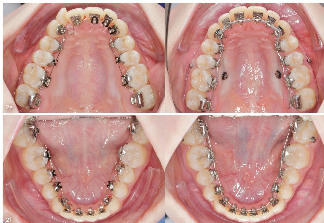
Abb. 2e: En-masse-Distalisation am .016"x.024" Stahlbogen mit Extratorque-Biegung (3-3) nach erfolgter Ausformung des Oberkiefers mit komprimiertem .014" Nickeltitanbogen. Abb. 2f: Nach vollständiger Nivellierung im Unterkiefer ist ein .018" Stahlbogen inseriert. Die nachts zu tragenden Klasse II-Gummizüge werden an den zweiten Molaren bukkal eingehängt.

Im Unterkiefer sollte in jedem Fall ebenfalls ein Stahlbogen inseriert werden. Die Gummizüge der Größe 3/16" und der Stärke 3,5 oder 6 oz