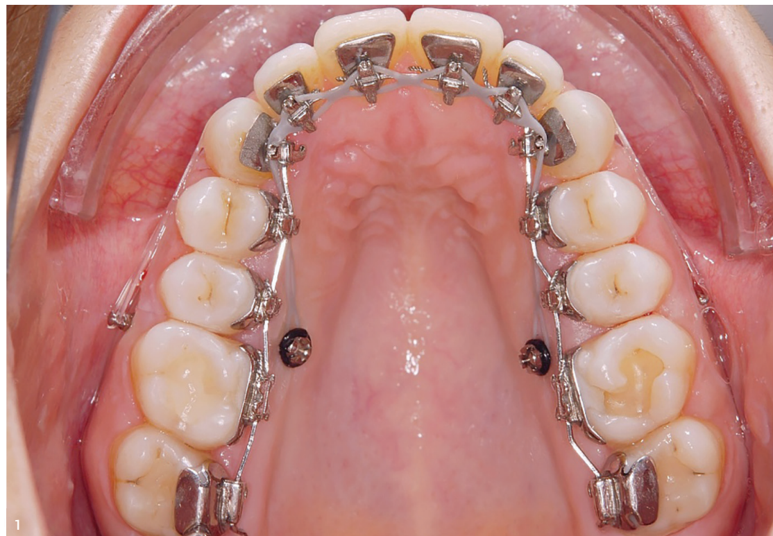
Abb. 1: En-masse-Distalisation mit vier Minischrauben im Oberkiefer am .016"x.024" Stahlbogen mit 13° Extratorque von 3-3. Pro Seite sind jeweils eine Minischraube bukkal und palatinal inseriert worden. Die graue, innen liegende Gummikette verhindert eine Lückenöffnung im anterioren Segment und zieht zu den palatinalen Minischrauben. Da der Patient nachts intermaxilläre Klasse II-Gummizüge tragen soll, verläuft sie am Eckzahn oberhalb des Bracketflügels. Die Zugkraft sollte 150–200 cN nicht überschreiten. Die transparenten bukkalen Gummiketten werden mit einem Lassoknoten auf dem Stahlbogen zwischen dem seitlichen Schneidezahn und dem Eckzahn fixiert und verlaufen dann unterhalb des Kontaktpunktes nach bukkal. Bei korrektem Einhängen (Rille im Schraubenkopf) können Gingivairritationen vermieden werden.

Palatinal werden Schrauben mit einem Durchmesser von 1,6 mm und einer Länge von 10 mm verwendet (z. B. Dual Top 16-JA-010N; Promedia Medizintechnik, Siegen, Deutschland; Abb. 1). Wie erwartet, ist eine dickere Schraube auch als Minischraube immer belastbarer als eine dünnere. Diese höhere Belastbarkeit ist bei der Insertion