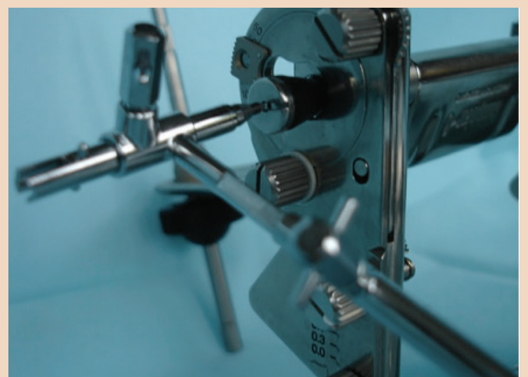
Abb. 2: Gerber Condylator mit Gerber Dynamic Facebow im Detail.

Trotzdem bin ich der Überzeugung, der direkte Dialog zwischen Menschen ist unersetzlich. Ich denke, dass die IDS im kommenden Jahr wieder ein einzigartiges Treffen der gesamten Dentalwelt sein wird, bei dem die Freude, mit ande-