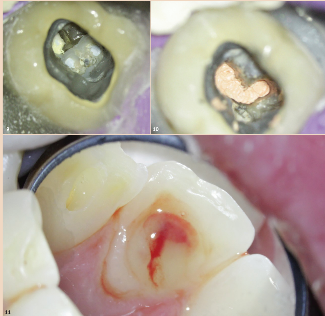
Abb. 9: Zahn 37 Zustand vor Revision. – Abb. 10: Zustand nach Revision und Wurzelfüllung, C-Konfiguration des Wurzelkanalsystems. – Abb. 11: Pus-Austritt bei apikalem Abszess am Zahn 22.

Aufbereiten aller Haupt- und akzessorischer Wurzelkanäle, das Entfernen von Fremdmaterial (z. B. Instrumentenfragmente) und „altem“ Wurzelfüllmaterial sowie eine ausreichend lange Einwirkzeit der Spüllösungen. Für die Entscheidung Single-Visit- oder mehrzeitige Behandlung scheint das Vorhandensein einer apikalen Os-