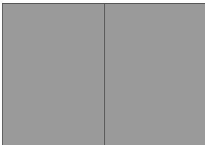
Anzeige + PR Firmenprofil: 2.250 €