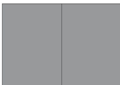
Anzeige + PR Firmenprofil: 2.250 €