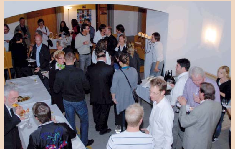
Apéro im Foyer des Schlosses.