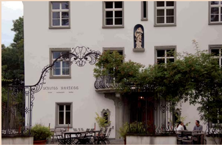
Eingang zu Schloss Wartegg, heute im Privatbesitz und gern genutzter Tagungsort.

nem Foto einer Seitenzahnversorgung von vor etwa 20 Jahren. Dort sah man alte Goldinlays, brüchige Amalganfüllungen, Komposit (oder Kunststofffüllungen) mit grossen Randspalten und in einer Form, welche mit dem Zahn nicht mehr viel zu tun hatte.