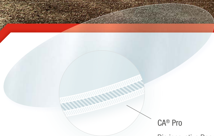
CA ® Pro

CA ® Pro: Nie war eine Alignerfolie so ausdauernd.