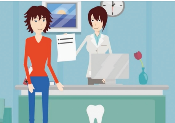
Der neue goDentis-Film erklärt Patienten die Vorteile einer Zahnzusatzversicherung.

goDentis Scheidtweilerstraße 4, 50933 Köln Tel.: 0221 5784492 info@godentis.de www.godentis.de