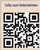
Infos zum Unternehmen