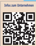
Infos zum Unternehmen

Mit der neuesten Hydrosonic pro-Schallzahnbürste können Sie Ihren Patienten eine optimale Mundpflege für zu Hause bieten.