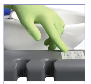
Schlauchspülung auf Knopfdruck