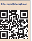
Infos zum Unternehmen