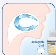
Fortsetzung der Behandlung durch den Patienten zuhause