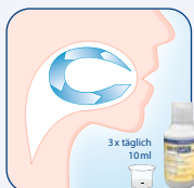
Fortsetzung der Behandlung durch den Patienten zuhause