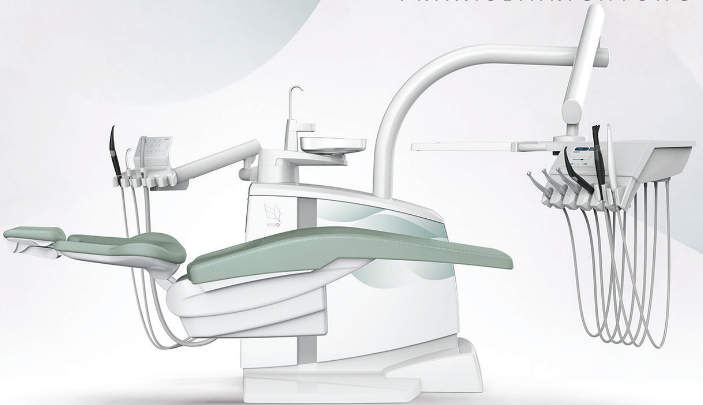
Abb. 1: Cherry Blossom: Die Kirschblüte als Inbegriff für Schönheit und Glück gilt in Japan als Symbol für den Aufbruch. Das facettenreiche und leichte Design „Cherry Blossom“ lässt sich sowohl hell, clean und verspielt als auch – z.B. mit dunklen Tönen kombiniert – kontrastreich und charakterstark inszenieren. Abb. 2: Bamboo: Der Farbe Grün wird eine beruhigende, ausgleichende und gleichzeitig erfrischende Wirkung zugeschrieben. Bambus gilt in Japan als Symbol für Reinheit. Die geschwungenen Formen wirken elegant sowie leicht und erzeugen ein sanftes, wohliges Raumgefühl.

Patientinnen und Patienten sicher und wohlfühlen, ein wesentlicher Aspekt. Eine Atmosphäre der Gelassenheit und Ruhe in Räumlichkeiten mit Charakter und dem gewissen Etwas sorgt bewusst und unbewusst für ein angenehmeres, positives Erleben des Zahnarztbesuchs. Genau hierfür bietet KaVo mit einem spannenden 360°-Interieurkonzept rund um die Behandlungseinheiten die passende Lösung: Die neue Design Edition inspired by Japan.