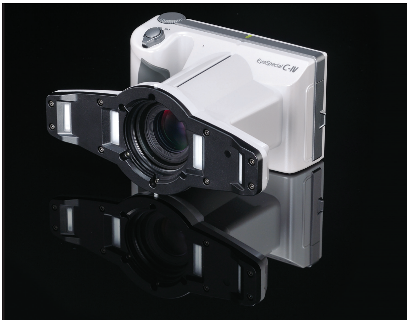
Abb. 1: Die EyeSpecial C-IV Dentalkamera.

nutzern Gedanken über Ringblitz, Lateralblitz, Blende, Tiefenschärfe und mehr einfach ab“, erklärt der Produktverantwortliche für Europa, Ingo Scholten. „Diese Kamera hat alles, damit aussagekräftige Patientenbilder aus dem Effeff gelingen – ganz ohne fotografisches Spezialwissen und ohne Zusatzausrüstung. Dank der smarten integrierten Funktionen wird jedes Bild ein gutes Bild: kontrastreich, tiefscharf und farbecht. Die Kamera schafft selbst die Bedingungen, die zu einem guten Bild führen. Ohne zeitraubendes Ausrichten von Blitzen und anderen Um- und Einstellungen.“