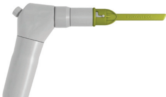
Abb. 3: Riskontrol mit Multifunktionsspritze.

tiv reduziert. Das Verhalten von Produkten anderer Marktteilnehmer weist vergleichsweise weniger Kontrolle über die Wassermenge auf; die Newtron®-Ultraschallgeneratoren von ACTEON® benötigen die geringste Wasserdurchflussrate. 6 Newtron® ermöglicht darüber hinaus mit seinem unabhängigen Tank zum Befüllen die Anwendung von Desinfektionslösungen wie Povidon-Iod, das die Menge von Erregern im oralen Trakt und den Atemwegen reduzieren kann.