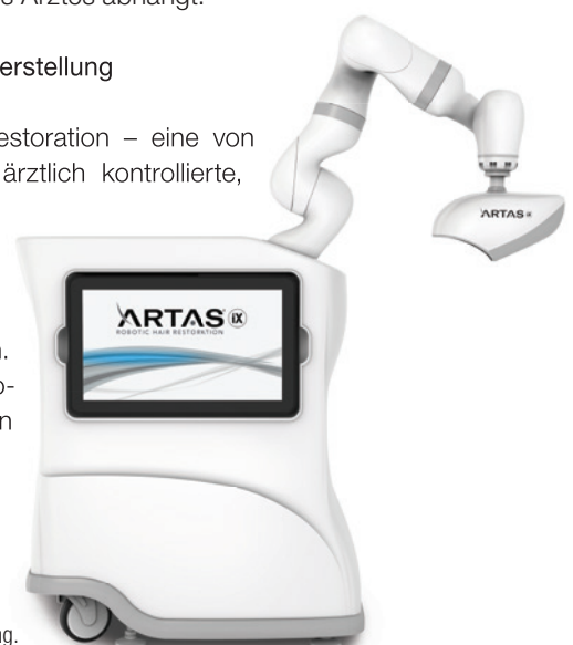
Abb. 2: Die ARTAS Roboter-Haarwiederherstellungsausrüstung.

ARTAS Robotic Hair Restoration – eine von der FDA zugelassene, ärztlich kontrollierte, robotergestützte Technologie – ist ein wahrhaft hochmoderner Ansatz zur minimalinvasiven Haartransplantation. Die Fähigkeit eines Roboters zur Entnahme von