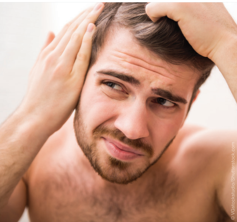
Abb. 3: Die Ausdünnung und schließlich der Verlust von Haaren geschehen nach einem genau definierten Muster, wobei der Haaransatz zunächst zurückweicht. Das Haar wird in der Nähe des Oberkopfes allmählich dünner und entwickelt sich oft zu einer teilweisen oder vollständigen Kahlheit bei Männern.