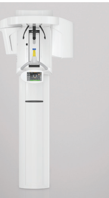
Der Orthophos S ist ein hochwertiges 2D-/3D-Röntgengerät mit umfassendem Leistungsspektrum für jede Praxis.

Interessenten können bis Ende des Jahres die Preisvorteile von Dentsply Sirona nutzen. Auf der Website www.dentsplysirona.com/echt , über die Telefon-Hotline +49 621 4233-320 oder per Fax unter +49 621 4233-579 können Termine für eine Live-Demo oder weitere Informationen angefragt werden. Zusätzlich zu den Preisvorteilen von Dentsply Sirona profitieren Käufer natürlich von den Investitionsvorteilen des Konjunkturpakets der Bundesregierung: Bei Lieferung des Gerätes noch in 2020 greift die reduzierte Mehrwertsteuer von 16 Prozent. Durch die Wiedereinführung der degressiven AfA (Absetzung für Abnutzung) können steuerliche Entlastungen zeitlich vorgezogen werden. Darüber hinaus ist es möglich, bei Vorliegen der Förderungsvoraussetzungen über die Hausbank zinsgünstige öffentliche Mittel mit Laufzeiten bis zu zehn Jahren und zwei tilgungsfreien Jahren zu nutzen.