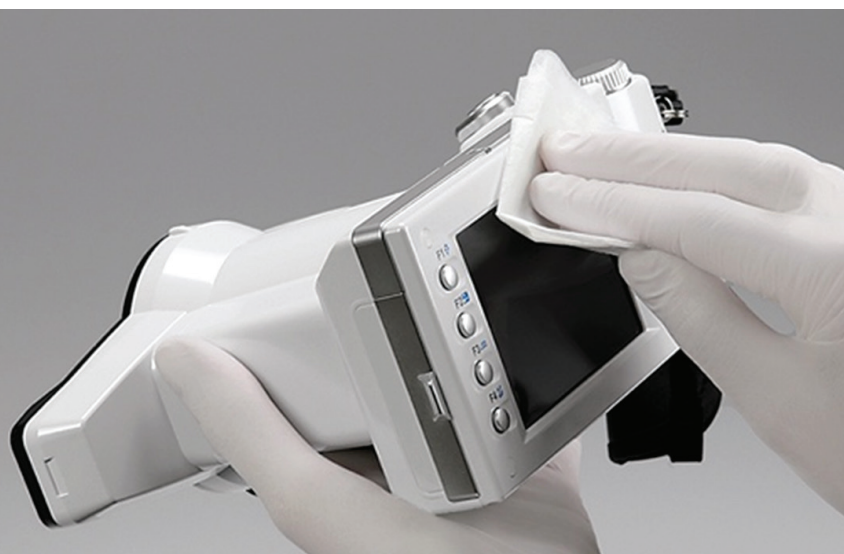
Die Kamera kann mit Ethanol gereinigt und desinfiziert werden.