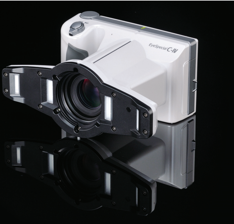
Die EyeSpecial C-IV Dentalkamera.

Es gibt viele Wege, um in der Dental- fotografie gute Ergebnisse zu erzielen: mit dem modifizierten Smartphone, der spiegellosen Kompaktkamera oder der aufgerüsteten Spiegelreflexkamera. Jede dieser „Damit geht's auch“-Lösungen hat Nachteile. Sie sind entweder umständlich, erfordern umfassendes fotografisches Fachwissen, Training und Investitionen in zusätzliches Equipment, lassen sich nur mit erheblichem Aufwand in den Praxisalltag integrieren – oder kombinieren all diese Nachteile.