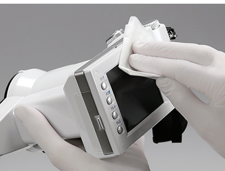
Die Kamera kann mit Ethanol gereinigt und desinfiziert werden.