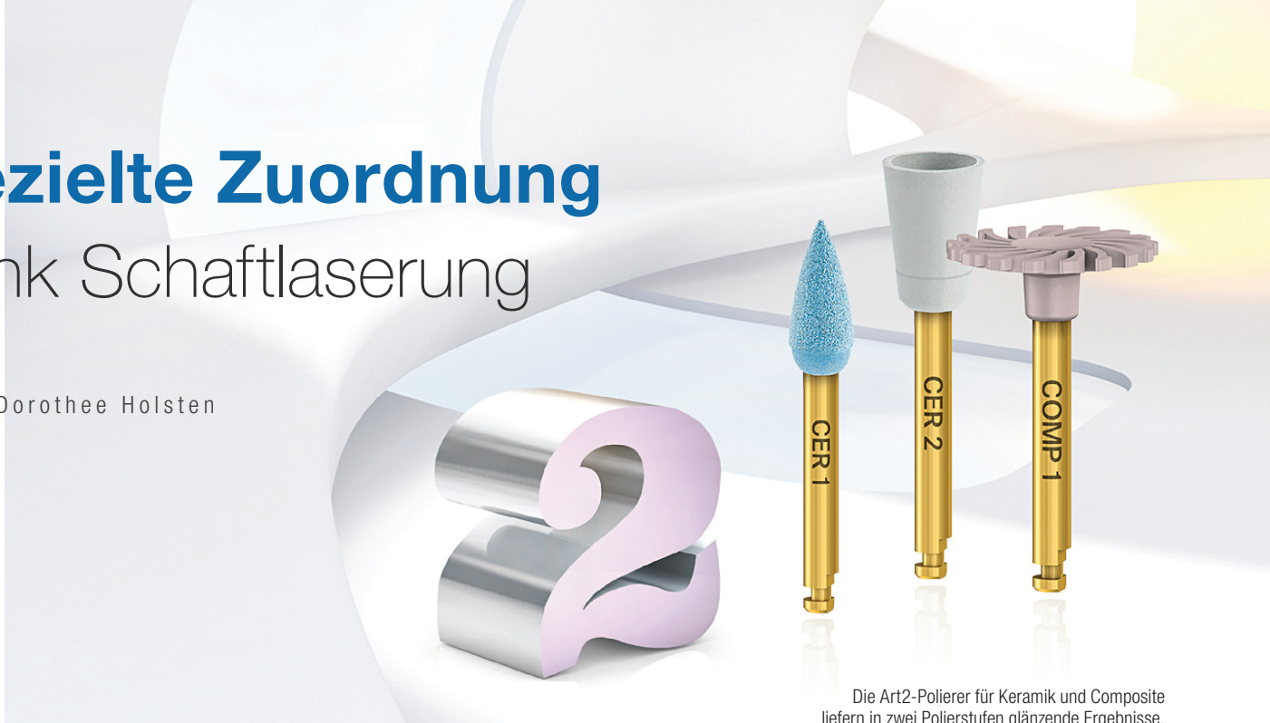
Die Art2-Polierer für Keramik und Composite liefern in zwei Polierstufen glänzende Ergebnisse.

HERSTELLERINFORMATION >>> Wie finde ich meine gewünschten Polierer in der Schublade? Der gezielte Griff zu den Art2-Polierern erfolgt jetzt nicht mehr allein über die Farbe des Arbeitsteils, sondern zusätzlich über gelaserte Schriftzüge am Schaft.