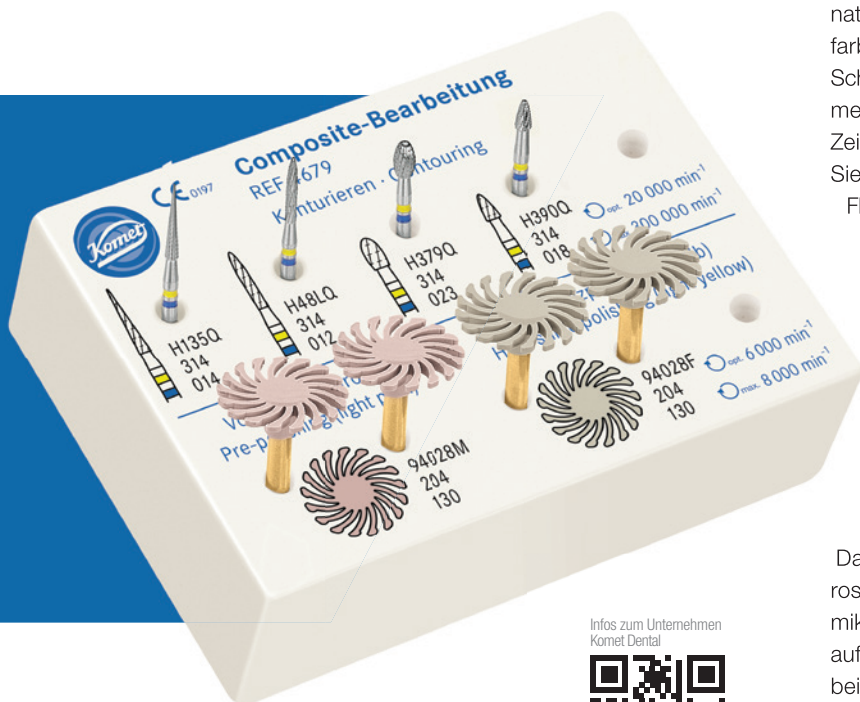
Im Set 4679 sind die Art2-Polierer mit den beliebten Q-Finierern kombiniert.

Alle Art2-Polierer besitzen einen goldenen Schaft. Dann auf die Farbe des Arbeitsteils achten: Hellrosa/Gelb für Composite, Hellblau/Grau für Keramik. Spiegelverkehrt zum Schriftzug „Komet“ steht auf der anderen Schaftseite CER 1 bzw. CER 2 (die beiden Polierstufen für Keramik) oder COMP 1 bzw. COMP 2 (die beiden Polierstufen für Composite). Alles in standfester Laserqualität. Finden und Sortieren vor der Behandlung bzw. nach der Aufbereitung