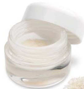
Puros Allograft Blend Kortiko-Spongiose Partikel

Die Familie der Puros Knochenersatzmaterialien wird zur Füllung von Knochendefekten bei Patienten, die eine Knochenaugmentation im Unter- und Oberkiefer benötigen, eingesetzt. Puros Allografts werden durch den Tutoplast®-Prozess verarbeitet, der das Bereitstellen steriler Produkte bei gleichzeitiger Erhaltung der Biokompatibilität und strukturellen Integrität ermöglicht. 1