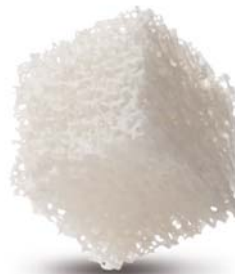
Puros Allograft Spongiosa-Block