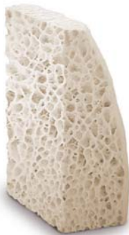
Puros Allograft Block