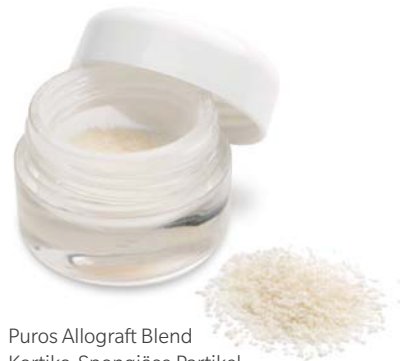
Puros Allograft Blend Kortiko-Spongiose Partikel

Die Familie der Puros Knochenersatzmaterialien wird zur Füllung von Knochendefekten bei Patienten, die eine Knochenaugmentation im Unter- und Oberkiefer benötigen, eingesetzt. Puros Allografts werden durch den Tutoplast®-Prozess verarbeitet, der das Bereitstellen steriler Produkte bei gleichzeitiger Erhaltung der Biokompatibilität und strukturellen Integrität ermöglicht. 1