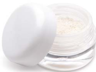
Puros Allograft Spongiosa-Partikel