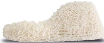
Puros Allograft Patientenindividueller Block