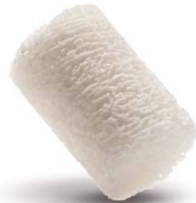
Puros Allograft Spongiosa-Dübel