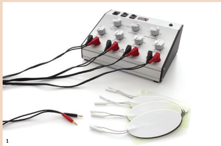
Abb. 1: Das LEUTZ tronic 8plus ist ein sehr kleines und handliches Gerät, sehr übersichtlich und leicht zu bedienen. In dem mitgelieferten, ausführlichen Anwenderhandbuch werden Auflageanordnungen für diverse Körperpartien übersichtlich und sehr verständlich vorgestellt. – Abb. 2: Bei Rückenproblemen werden die Pads paarweise, wie auf dem Foto abgebildet, angelegt. Ein angenehmes leichtes Kribbeln stellt sich ein. Um einen schnellstmöglichen Erfolg zu erzielen, sollte die Anwendung 1 x täglich über einen längeren Zeitraum erfolgen. Die Anlagepunkte lassen sich einfach erlernen.

Eine schwere Erkrankung und wenig Hoffnung auf restlose Heilung brachte den Entwickler Roland Leutz