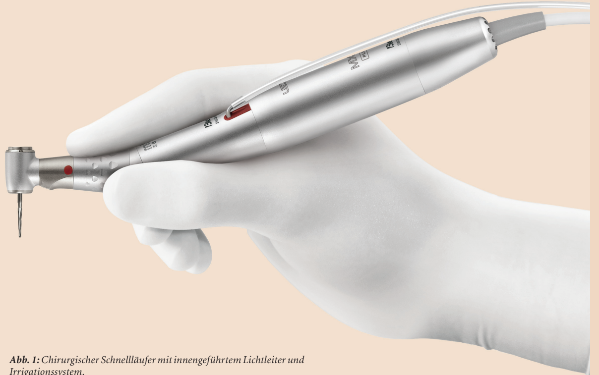
Abb. 1: Chirurgischer Schnellläufer mit innengeführtem Lichtleiter und Irrigationssystem.

Neben der üblichen Verwendung von Hand- und Winkelstücken für die Chirurgie und Implantologie können chirurgische Schnellläufer für moderne Behandlungskonzepte eingesetzt werden. Die Chirurgieeinheit Chiropro PLUS (Bien-Air) bietet eine zusätzliche Bedienebene für chirurgische Schnellläufer. Neben allen Schritten der Implantation können damit effizient minimalinvasive Osteotomien, Wurzelspitzenamputationen, Hemisektionen, Präparationen von Knochenblöcken, PET (Partial Extraction Therapy) sowie Entepithelisierungen von Bindegewebstransplantaten mit nur einem Gerät durchgeführt werden.