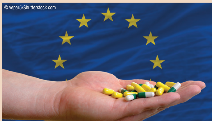
40 Prozent aller in der EU vermarkteten Arzneimittel kommen von außerhalb, 60 bis 80 Prozent der pharmazeutischen Zutaten werden in China und Indien produziert.

gen Medikamenten auch in Zukunft zu gewährleisten.“ Im Kampf gegen Lieferengpässe sei die transparente Kommunikation von Liefer- oder