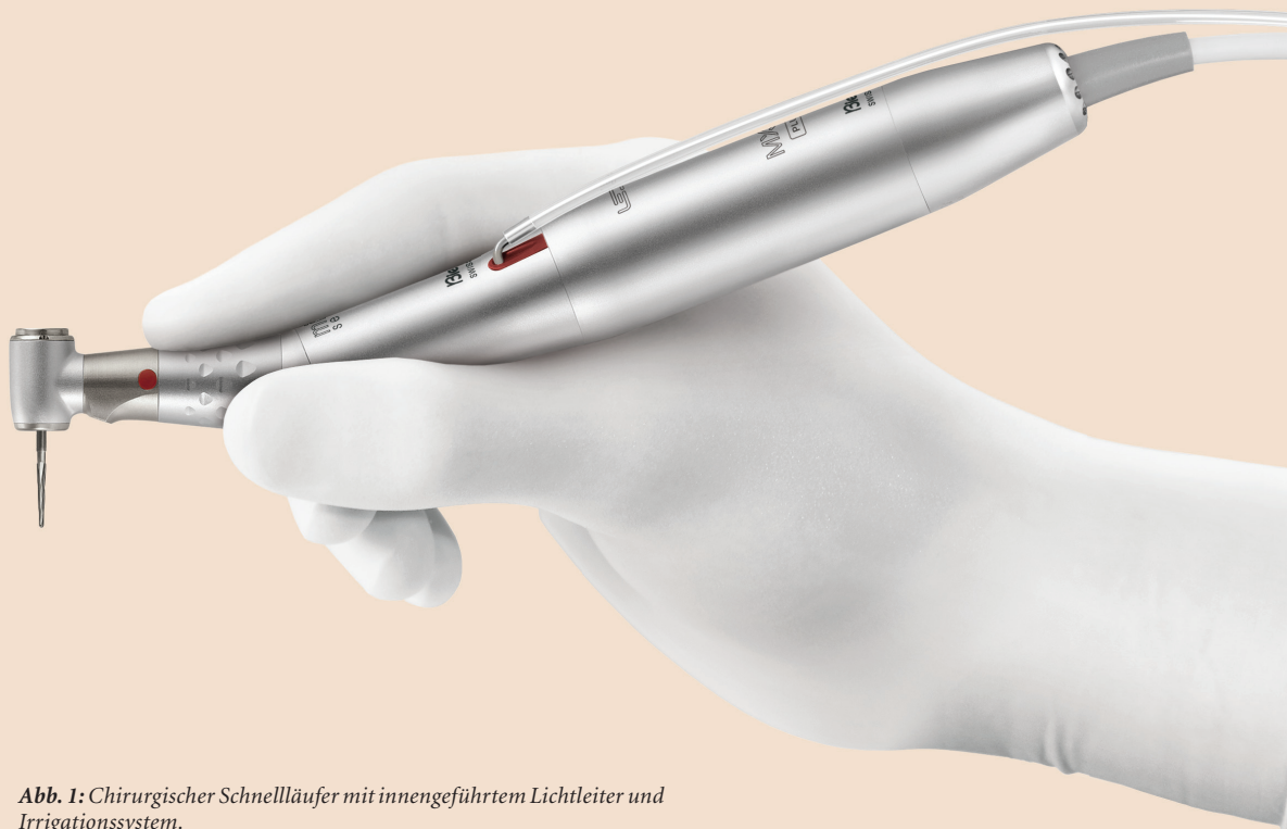
Abb. 1: Chirurgischer Schnellläufer mit innengeführtem Lichtleiter und Irrigationssystem.

Neben der üblichen Verwendung von Hand- und Winkelstücken für die Chirurgie und Implantologie können chirurgische Schnellläufer für moderne Behandlungskonzepte eingesetzt werden. Die Chirurgieeinheit Chiropro PLUS (Bien-Air) bietet eine zusätzliche Bedienebene für chirurgische Schnellläufer. Neben allen Schritten der Implantation können damit effizient minimalinvasive Osteotomien, Wurzelspitzenamputationen, Hemisektionen, Präparationen von Knochenblöcken, PET (Partial Extraction Therapy) sowie Entepithelisierungen von Bindegewebstransplantaten mit nur einem Gerät durchgeführt werden.