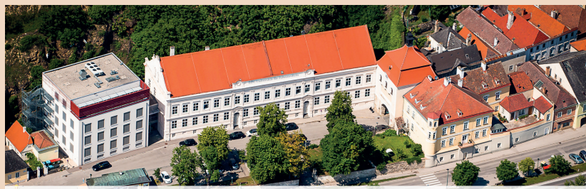
Die Danube Private University: Studieren, wo andere Urlaub machen – in der Weltkultur- und Naturerbelandschaft Wachau