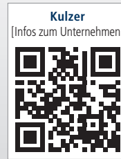
Kulzer [Infos zum Unternehmen]