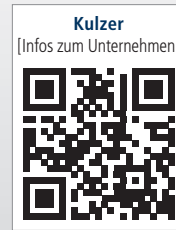
Kulzer [Infos zum Unternehmen]