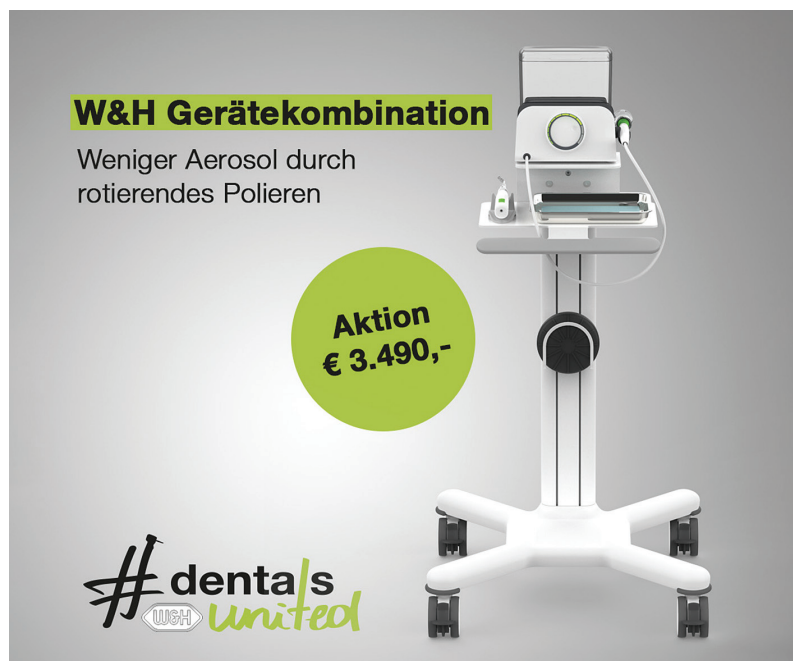
Die W&H Gerätekombination für aerosolreduziertes Arbeiten in der Prophylaxe.

Im folgenden Beitrag steht die Prophylaxe im Fokus, denn auch hier ist aerosolreduziertes Arbeiten möglich. Dies lässt sich konkret durch das kabellose Proxeo Twist Poliersystem PL-40 umsetzen. Bewusst wurde beim Handstück Proxeo Twist Cordless auf rotierendes Polieren gesetzt, dies reduziert die Aerosolbildung im Vergleich zu Pulverstrahlsystemen nachweislich. Die Prophy-Einwegwinkelstücke werden für jeden Patienten neu verwendet und die Hülse des Polierhandstückes nach der Anwendung unkompliziert maschinell aufbereitet. „Mit unserem Portfolio bei W&H können wir nicht nur individuell und patientenorientiert (IPC – Individual Prophy Cycle) arbeiten, sondern haben auch für spezielle schwierige Zeiten die passenden Geräte“, sagt