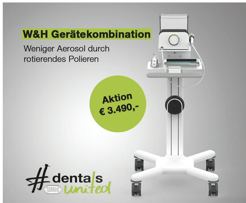
Die W&H Gerätekombination für aerosolreduziertes Arbeiten in der Prophylaxe.

Im folgenden Beitrag steht die Prophylaxe im Fokus, denn auch hier ist aerosolreduziertes Arbeiten möglich. Dies lässt sich konkret durch das kabellose Proxeo Twist Poliersystem PL-40 umsetzen. Bewusst wurde beim Handstück Proxeo Twist Cordless auf rotierendes Polieren gesetzt, dies reduziert die Aerosolbildung im Vergleich zu Pulverstrahlsystemen nachweislich. Die Prophy-Einwegwinkelstücke werden für jeden Patienten neu verwendet und die Hülse des Polierhandstückes nach der Anwendung unkompliziert maschinell aufbereitet. „Mit unserem Portfolio bei W&H können wir nicht nur individuell und patientenorientiert (IPC – Individual Prophy Cycle) arbeiten, sondern haben auch für spezielle schwierige Zeiten die passenden Geräte“, sagt