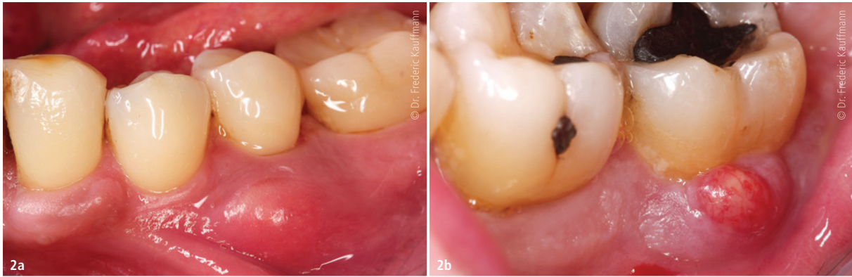
Abb. 2a und b: Parodontaler Abszess aufgrund subgingivaler Konkremete bei straffem, eng an den Zahn anliegendem Saumepithel nach PZR (sealing).

Parodonts, aber auch von der Mundhygiene des Patienten. Dabei gilt: Je höher der Entzündungsgrad und je schlechter die Mundhygiene, desto höher ist das Bakteriämierisiko. Das Saumepithel bildet als Übergang des Zahnfleisches hin zum Zahn und in das Zahnfach die einzige Stelle im Körper, an der Bakterien aufgrund einer Unterbrechung des Epithels in andere Regionen eindringen und über die Blutbahn verschleppt werden können. Beispielsweise können bei Patienten mit schweren Parodontitiden erhöhte Entzündungswerte im Blutbild festgestellt werden. In bakteriellen Kulturen des Blutes sind dann auch krankheitserregende Keime der Mundhöhle nachweisbar. Gerade bei Risikopatienten mit vorgeschädigtem Endokard oder Herzklappen kann durch eine Behandlung in der Zahnarztpraxis eine Endokarditis verursacht werden. Aber auch schlecht eingestellte Diabetiker, Patienten mit Zustand nach Gelenk-