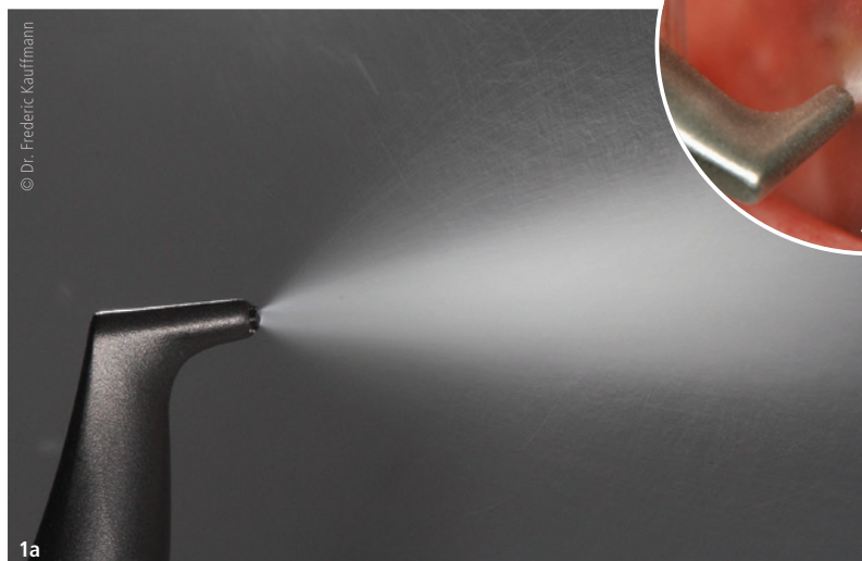
Abb. 1a und b: Pulver-Wasser-Strahlgerät mit Glycinpulver zum schonenden Reinigen und Polieren von supra- und subgingivalen Bereichen. Es sollte bei der Reinigung von Wurzeloberflächen darauf geachtet werden, möglichst immer in Bewegung zu bleiben und wenig abrasive Pulver zu verwenden. Anderenfalls steigt das Emphysemrisiko.

digtem Endokard, Herzschrittmacher, Organtransplantationen oder Diabetiker zählen. Auch bei Patienten mit stark vorangeschrittener Parodontitis können Komplikationen bei der Behandlung auftreten. 1 Es ist daher immer wichtig, vor der Behandlung Rücksprache mit dem betreuenden Zahnarzt zu halten und diesen ggf. im Ernstfall sofort über auftretende Komplikationen zu informieren.