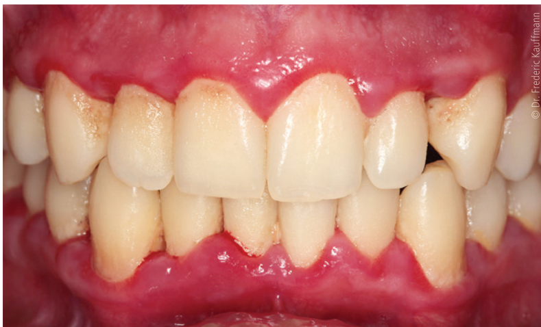
Abb. 3: Besonders bei Patienten mit Blutgerinnungs- und Thrombozytenaggregationsstörungen kann es bei einer solch ausgeprägten Gingivitis durch eine PZR oder Parodontitisbehandlung zu starken Blutungen kommen.

Bekanntermaßen stellen auch Patienten mit veränderter Blutgerinnung besonders bei chirurgischen Eingriffen ein Komplikationsrisiko in der Zahnarztpraxis dar. Aber auch bei einer Parodontitistherapie, seltener auch bei einer PZR, kann es zu erhöhten Blutungen kommen. Ist bei Patienten eine Einnahme von Thrombozytenaggregationshemmer wie beispielsweise ASS bekannt, kann die Blutungsgefahr jedoch abgeschätzt oder mit dem behandelnden Hausarzt besprochen werden. Größere Gefahr besteht bei Patienten, die unter einer noch nicht diagnostizierten Hämophilie oder dem