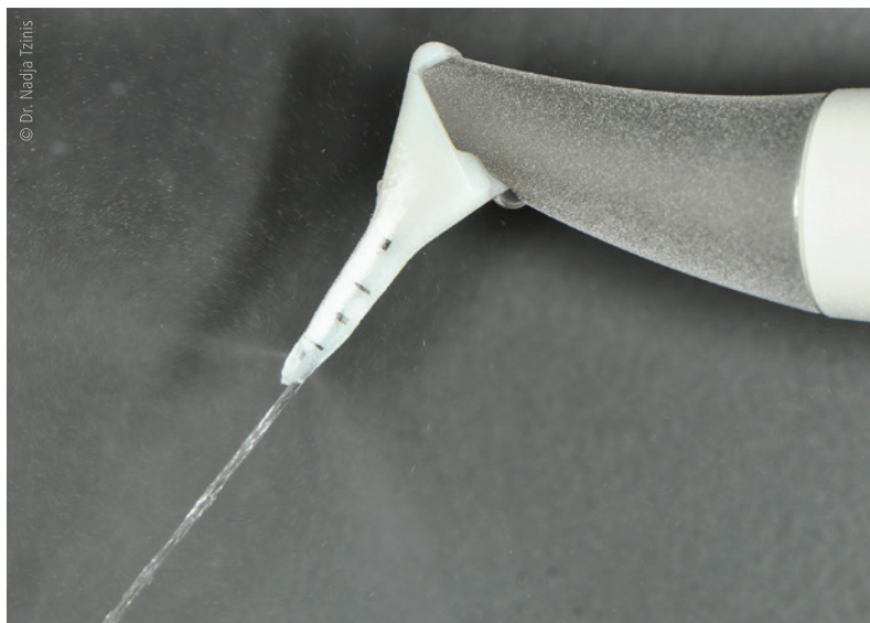
Abb. 1c: Pulver-Wasser-Strahlgerät mit Nozzle-Aufsatz zur subgingivalen Anwendung. Neben dem Wasserstrahl sind zwei Glycinpulverstrahlen in divergierender Richtung sichtbar.

Bei Patienten mit einer schweren Parodontitis und hoher Keimlast mit